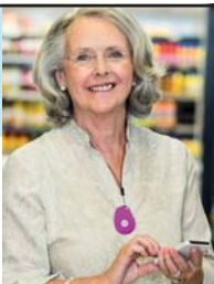
GPS Mobile Above

No Contract • No Fees • Easy Setup • md-medalert.com CALL 800-890-8615