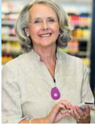
GPS Mobile Above

No Contract • No Fees • Easy Setup • md-medalert.com CALL 800-890-8615