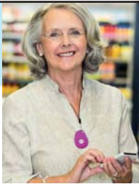
GPS Mobile Above

No Contract • No Fees • Easy Setup • md-medalert.com CALL 800-890-8615