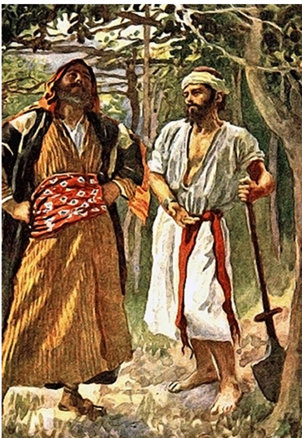
The parable of the Fig Tree by Harold Copping

Przypomnijmy sobie wszystkie nasze niespełnione postanowienia i obietnice. Niestety zapominamy o jednej bardzo ważnej rzeczy. Sami to nic nie potrafimy zrobić, bo człowiek jest słaby, a tylko udajemy wszechmogących. Nasza poprawa powinna brzmieć - mój wysiłek + łaska i moc Boga = poprawa i nawrócenie. Jeśli będziemy działać sami, to z góry jesteśmy skazani na przegraną. Tylko z Bogiem, między liśćmi zjawiają się i owoce.