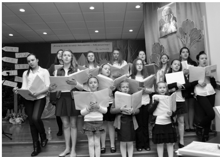
Promyki św. Jana Pawła II podczas Akademii dziewczynnej i Koncert Chórów

Tegoroczny Festyn wiosenny odbędzie się w Niedzielę, 1 czerwca w godz. 12:30 pm - 5:00 pm. Serdecznie zapraszamy!