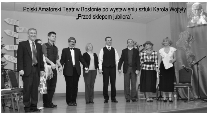
Polski Amatorski Teatr w Bostonie po wystawieniu sztuki Karola Wojtyły „Przed sklepem jubilera”.

Please pray for the sick, homebound and hospitalized Módlmy się za chorych, cierpiących, przebywających w szpitalach: